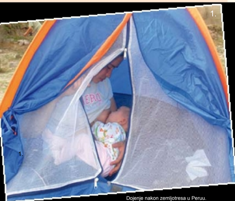
Dojenje nakon zemljotresa u Peru.